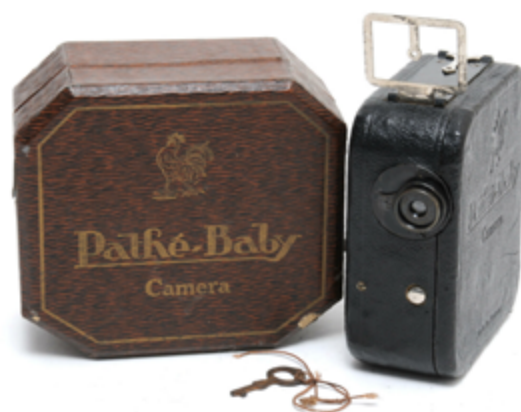
Càmera Pathé Baby dels anys 20.

Tenint en compte que, Riña en un café (1897), la primera pel·lícula espanyola amb argument, va rodar-la Fructuós Gelabert amb una càmera autoconstruïda, i que cap dels actors no va cobrar per la seva feina (tots eren amics del cineasta, i ell mateix és un dels protagonistes), podríem dir que el cinema amateur no només existeix a Catalunya des del naixement del setè art, sinó que és l’origen del cinema català.