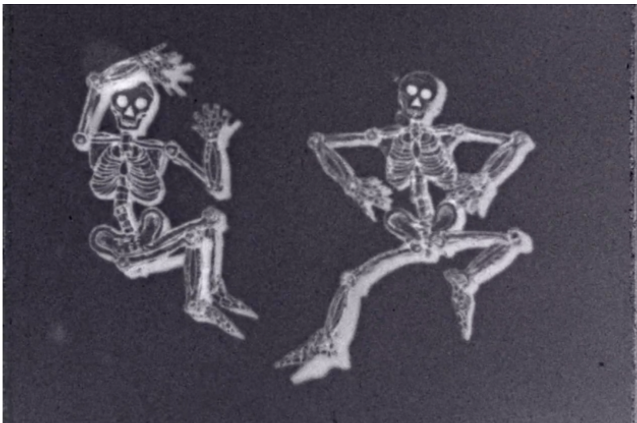
Fotograma del curtmetratge d'animació amateur La posada del terror (Adolfo Gaisser Foix, 1935).

Amateur del Centre Excursionista de Catalunya (1932) va ser la pionera i la més gran entitat d'aquest tipus; i el mateix any celebra el primer concurs amateur estatal. Domènec Giménez i Botey (Barcelona, 1907 - 1976), el director de Reflexes , va col·laborar intensament amb aquesta entitat.