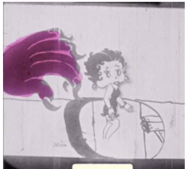
Fotograma de La posada del terror , curtmetratge protagonitzat per la flapper Betty Boop.