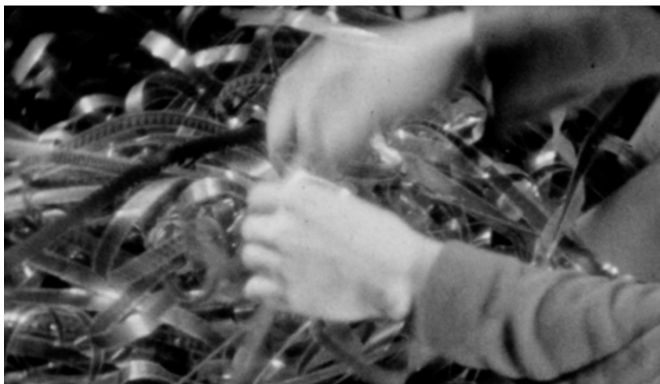
Fotograma del curtmetratge experimental amateu Aquesta nit no surto (Francesca Trián Massana, 1934).