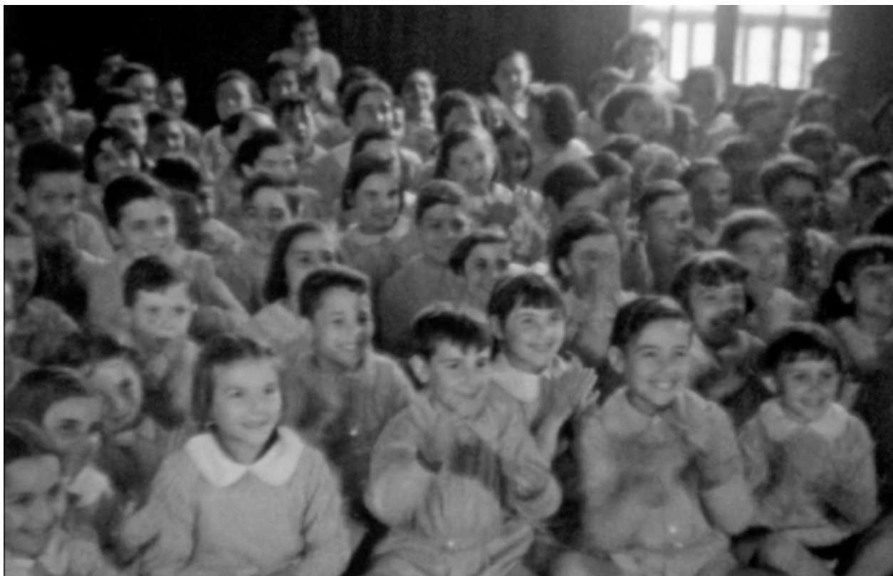
Fotograma del curtmetratge documental amataeur Escola del mar (Joan Serra i Oller, 1936).

Gaisser Foix, practica també l'apropiacionisme, en aquest cas del personatge de Betty Boop, el personatge de dibuixos animats creat per Grim Natwick i Ted Sears als anys 30. I el resultat és d'allò més creatiu i original. Tot i que en un anàlisi més profund podem observar com l'elecció del personatge de la Betty Boop, símbol de la dona flapper (anglicisme que s'utilitzava en els anys 1920 per a referir-se al nou estil de vida de les dones joves que vestien faldilles curtes, lluien el cabell curt, escoltaven jazz, bevien licors forts, fumaven, conduïen sovint a altes velocitats i tenien conductes similars a les d'un home; representant un desafiament al que en aquell temps era considerat socialment correcte), per a sotmetre-la a tota mena d'esglais, temors i càstigs, sembla castigar d'alguna manera —potser inconscient— la conducta d'aquestes dones sexualitzades i