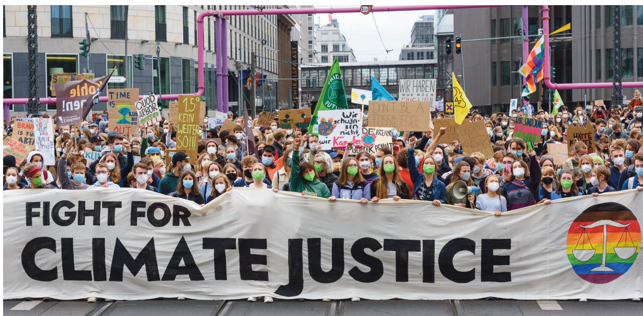
La comicitat i la ironia amb rerefons crític són habituals en el cinema d'Aki Kaurismäki.

Un dels aspectes més destacables de les dues peces audiovisuals és l'acurat treball de so. Si en el cas de Blow! el soroll humà que afecta negativament la vida de les espècies marines és omnipresent, a Cuerdas és el monstruós i abominable brogit d'una refineria de petroli situada al mig d'un poble la que afecta negativament en la vida i la salut dels seus habitants.