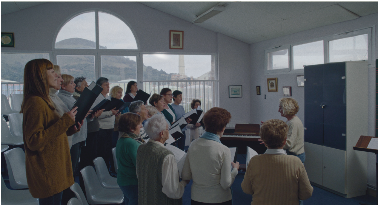
Fotograma de Cuerdas .

Blow! i Cuerdas , el binomi de curtmetratges que vertebraven aquest programa didàctic, tenen molt en comú; fins i tot més del que podria semblar en un primer moment. El més evident, potser —però no per això menys remarcable—, és que es tracta de dues pel·lícules escrites, produïdes i dirigides per dones. Dues dones, a més a més, de la mateixa generació, amb una forta identitat territorial i amb una mirada i una forma d'entendre el cinema que implica un llenguatge lliure, socialment compromès i en constant evolució. I ambdues utilitzen eines documentals, de ficció i experimentals per tractar alguns dels temes contemporanis més rellevants, com són el gènere, l'estat d'emergència climàtica, l'extractivisme i les desigualtats socials.