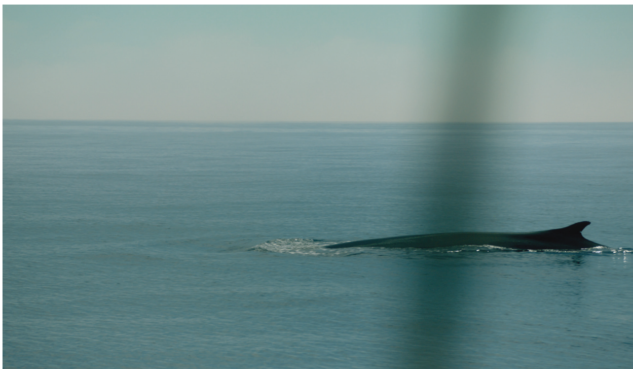
Albirament d'una balena a Blow!

És molt possible que els i les alumnes que no estiguin familiaritzats amb els llenguatges cinematogràfics més autorals i poc comercials de les noves fornades de realitzadores els hi sorprenguin algunes decisions relatives a l'aspecte visual, els tipus de pla i la durada d'aquests, l'ús de plans seqüència en lloc del muntatge, l'ús de càmera tremolosa en comptes de fixa, la narració cuinada a foc lent, l'elecció d'unes protagonistes poc 'normatives', la interpretació no professional de les actrius, el