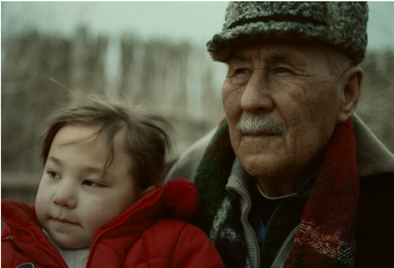
Fotograma de Memoria .

L'emergència climàtica s'ha convertit en el principal desafiament al qual ens enfrontem en l'actualitat i, a conseqüència, se'ns presenten grans reptes mediambientals. Segons l'ONU, tenim deu anys per a evitar que els seus efectes siguin irreversibles. Els tres curtmetratges d'aquest programa tracten algunes de les qüestions més urgents, i alhora que obren una finestra a la reflexió i conviden a repensar la nostra forma d'habitar el planeta.