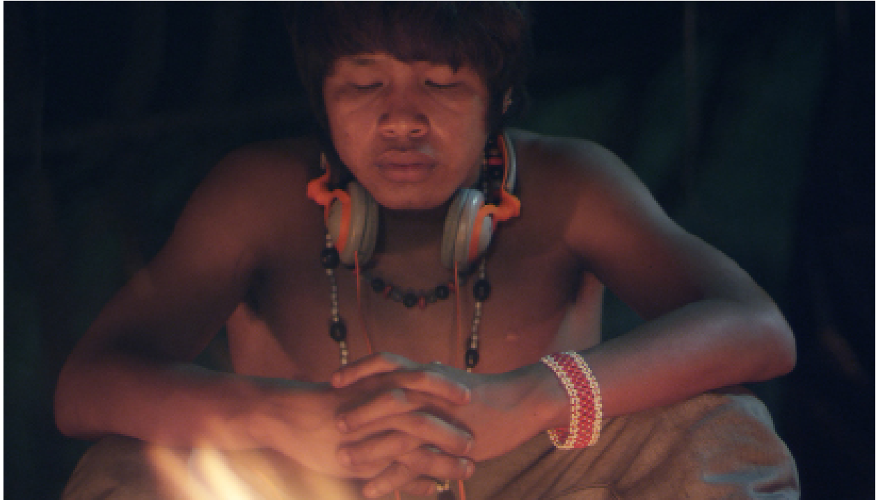
Fotograma de La canoa de Ulises .

Moltes pel·lícules no només han posat en contacte a les persones amb la naturalesa i els paisatges considerats exòtics per la mirada eurocèntrica, sinó que porten a terme una militància activa en la lluita per la defensa del medi ambient. La narrativa audiovisual (tant en el documental com en la ficció) és una finestra, una eina que pot ajudar-nos a conèixer altres pensaments, problemàtiques, modes de vida i costums, ajudant-nos així a canviar actituds i hàbits que ens limiten, estratègies creatives, millorar la comunicació, afavorir el debat social i rebutjar els discursos merament catastrofistes: en definitiva, a repensar i transformar la societat de la qual formem part.