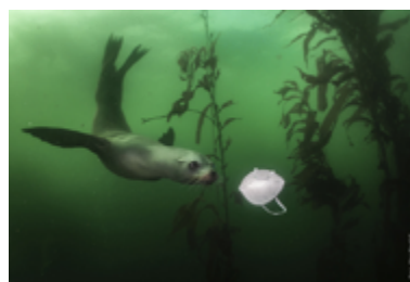
California Sea Lion Plays with Mask (Ralph Pace, 2021)