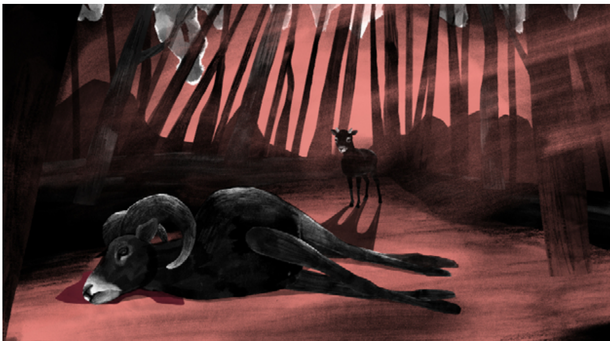
Fotograma de Las invasiones biológicas. El caso del Ovis orientalis musimon en la isla de Tenerife: «El último muflón» .