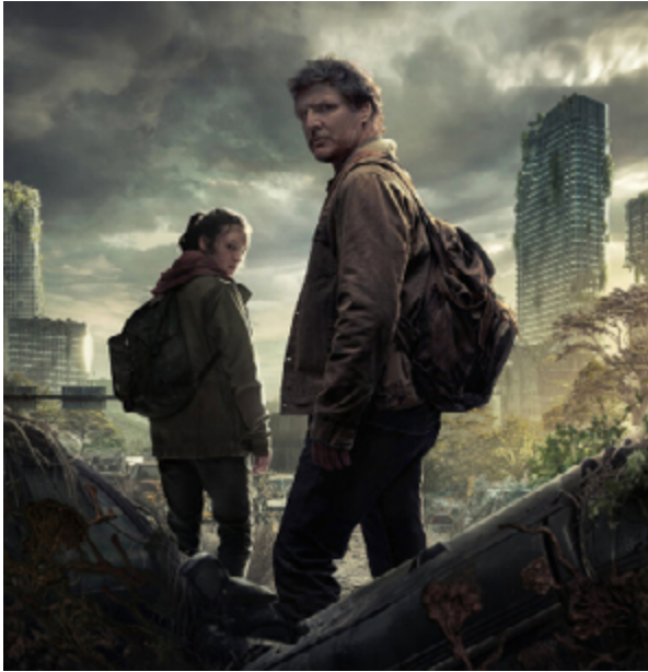
The Last of Us (2023) és un exemple de sèrie postapocalíptica.

La representació de l'apocalipsi i de la fi del món s'ha convertit en un tòpic recurrent dins de les narratives audiovisuals, ja sigui en mitjans tradicionals com la premsa, la ràdio, el cinema, la publicitat i la televisió, com en els videojocs o les xarxes socials. A la situació d'emergència climàtica (amb fenòmens meteorològics extrems), la divisió nord-sud i la pandèmia global viscuda el 2020, cal afegir el perill nuclear que estan revifant els actuals conflictes bèl·lics (per no mencionar altres alarmes col·lectives de nou encuny, com el control social a través de la tecnologia o la possibilitat de mals usos de la IA), fets que han propiciat que els relats distòpics adquireixin un nou significat en transformar-se en possibilitats reals, ja que el perill s'ha traslladat del terreny de la ficció a la pròpia vida. Així, les narratives clàssiques de plagues, desastres