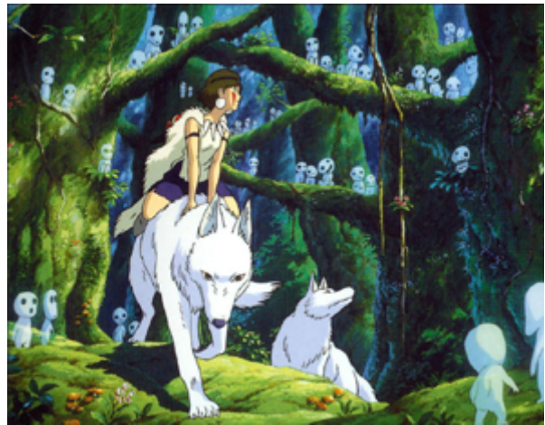
Fotograma de La princesa Mononoke .

Més enllà d'aquest programa, moltes pel·lícules han retratat les lluites ecologistes. Mothers of the Revolution (Briar March, 2021), per exemple, restitueix la memòria dels milers de dones de tot el món que, entre el 1981 i el 2000, van instal·lar un campament a les