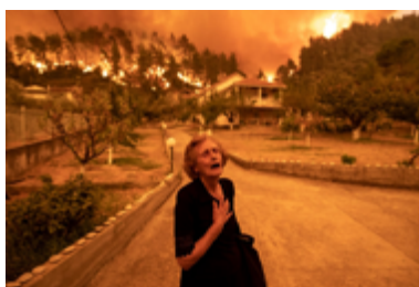
Evia Island Wildfire (Konstantinos Tsakalidis, 2022)