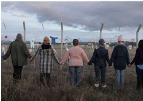
Fotograma de Mothers of the Revolution .

El último muflón , al seu torn, a través del cinema d'animació, inspira empatia i compassió vers els animals alhora que planteja un problema complex: l'amenaça que suposa per a la biodiversitat d'un territori la introducció a mans de les persones d'una espècie que, sense tenir cap culpa, ha posat en perill l'equilibri ambiental, la fauna i la flora autòctona.