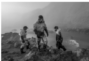
Oil spill in Lima (Musuk Nolte, 2023)

La fotografia, així com el cinema, esdevé un espai i un llenguatge idoni per criticar, reflexionar i repensar la societat. Cada vegada són més els fotògrafs i les fotògrafes que dediquen la seva pràctica a projectes relacionats amb la crisi climàtica i el medi ambient. Proposem dividir l'aula en quatre, ja que cada grup serà l'encarregat d'investigar i analitzar una fotografia de denúncia sobre algun problema mediambiental, amb l'objectiu final de presentar-ho a la resta de l'aula. L'anàlisi es basarà a descriure el que denotem (Què veiem?) i el que connotem (Què simbolitza i interpretem?) de la fotografia. És important que cada grup investigui al voltant de la fotografia per entendre què suggereix i així poder fer una anàlisi connotativa més interessant. Es pot investigar intentant respondre aquestes dues preguntes: Qui l'ha feta i on? Què explica o denuncia la fotografia?