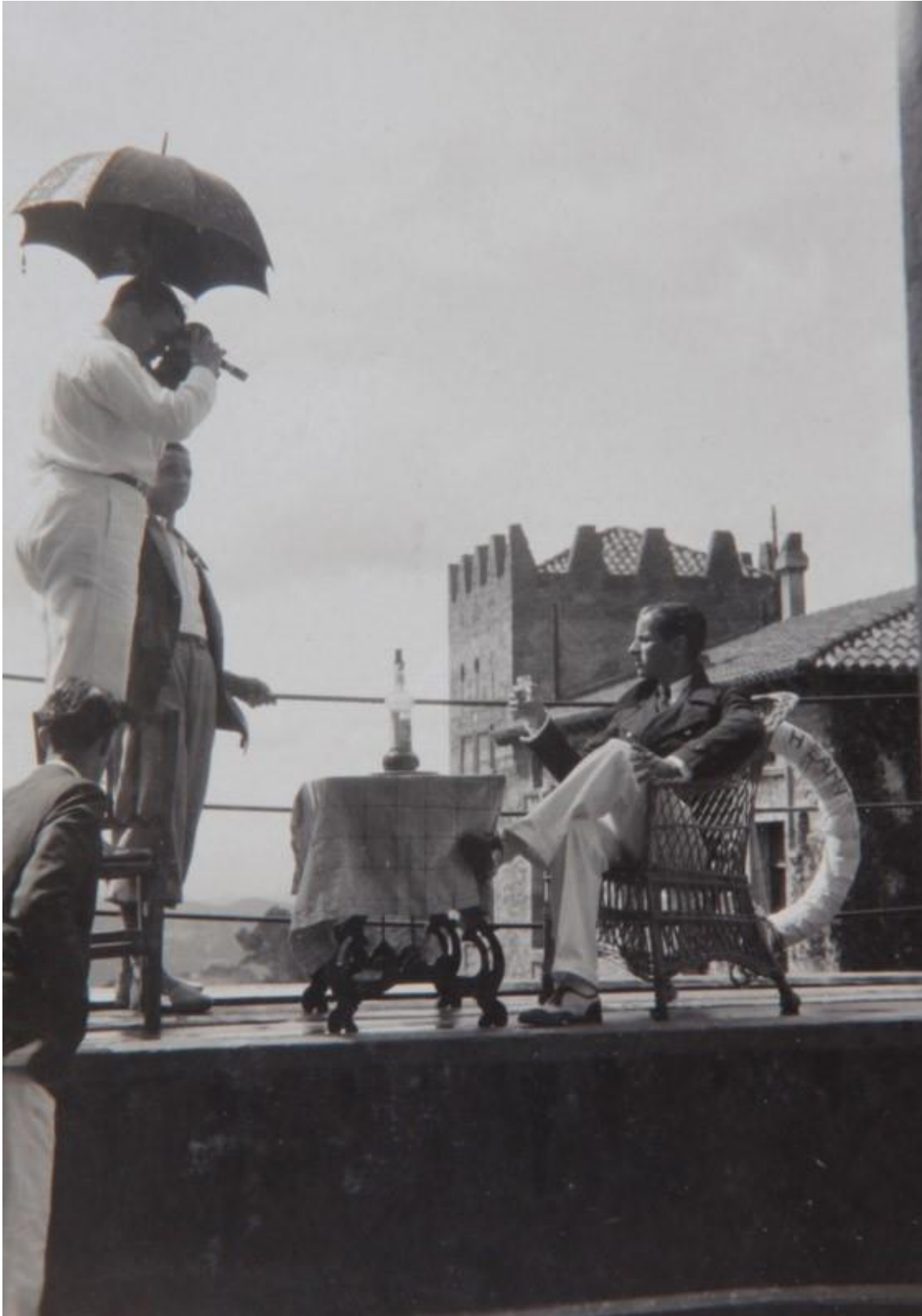
Rodatge de La isla desierta .