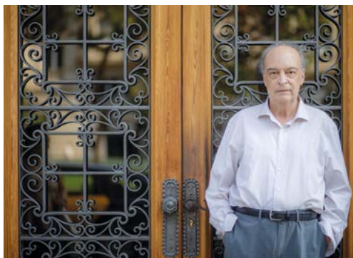
© Antonio Navarro Wijkmark - Seix Barral - Enrique Vila Matas