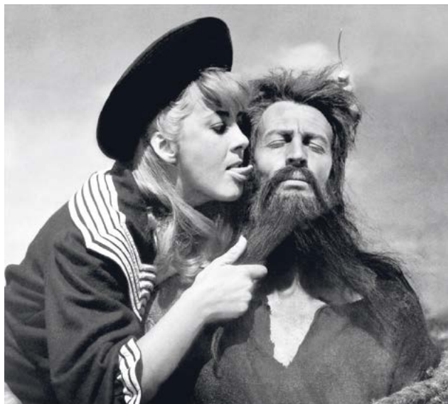
Simón del desierto (Luis Buñuel, 1965)