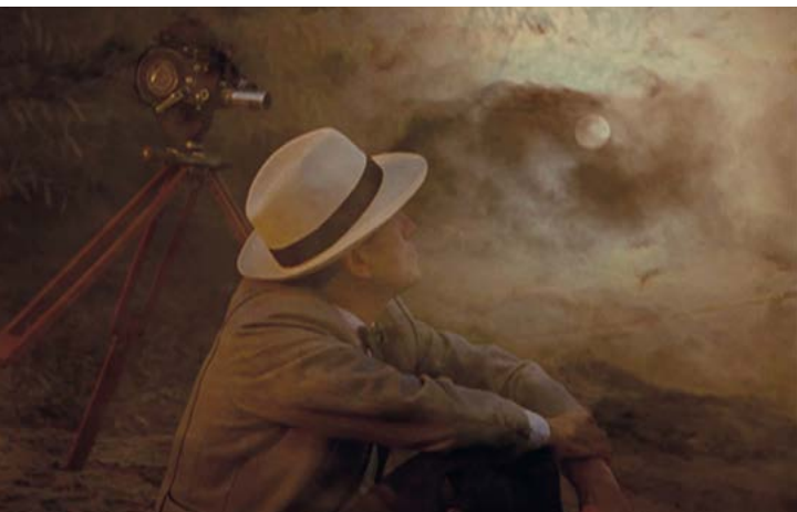
Tren de sombras (José Luis Guerín, 1997)

A les tasques de conservar, restaurar i preservar, la Filmoteca no pot renunciar a afegir la de difondre. Per a això, en el context digital predominant en l'exhibició cinematogràfica, és imprescindible la posada en marxa d'un pla sistemàtic que aquest primer any ha digitalitzat 8 llargmetratges i 8 curtmetratges realitzats a Catalunya a partir dels anys 40 del segle passat i dels quals no es disposa de còpies digitals. Aquests títols s'afegiran al catàleg Bàsic del Cinema Català i Singulars de la Filmoteca, que ja compta amb 25 llargs i 40 curts en suport digital.