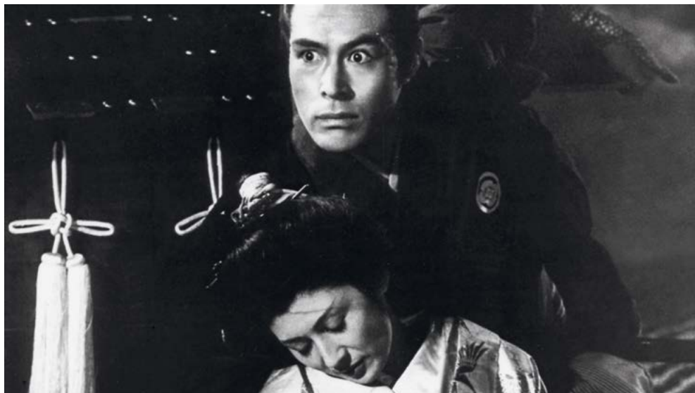
Samurai Rebellion (Jôi-uchi: Hairiyô tsuma shimatsu, Masaki Kobayashi, 1967)