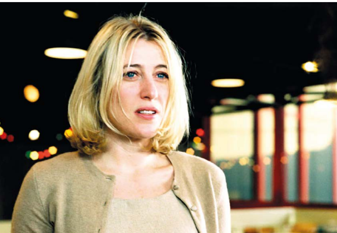
Actrices (Valeria Bruni Tedeschi, 2006)