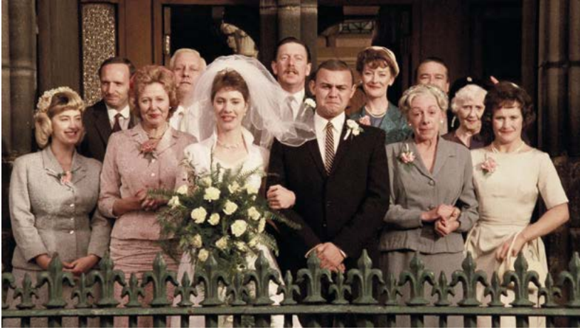
Distant Voices, Still Lives (Terence Davies, 1988)