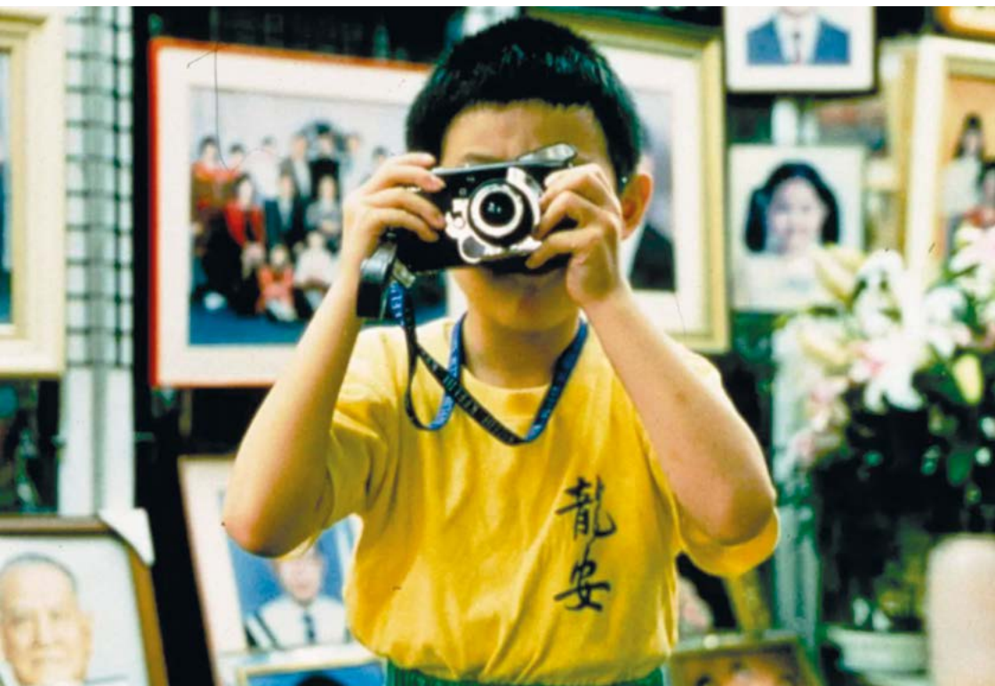
Yi yi (A One and a Two) (Edward Yang, 2000)