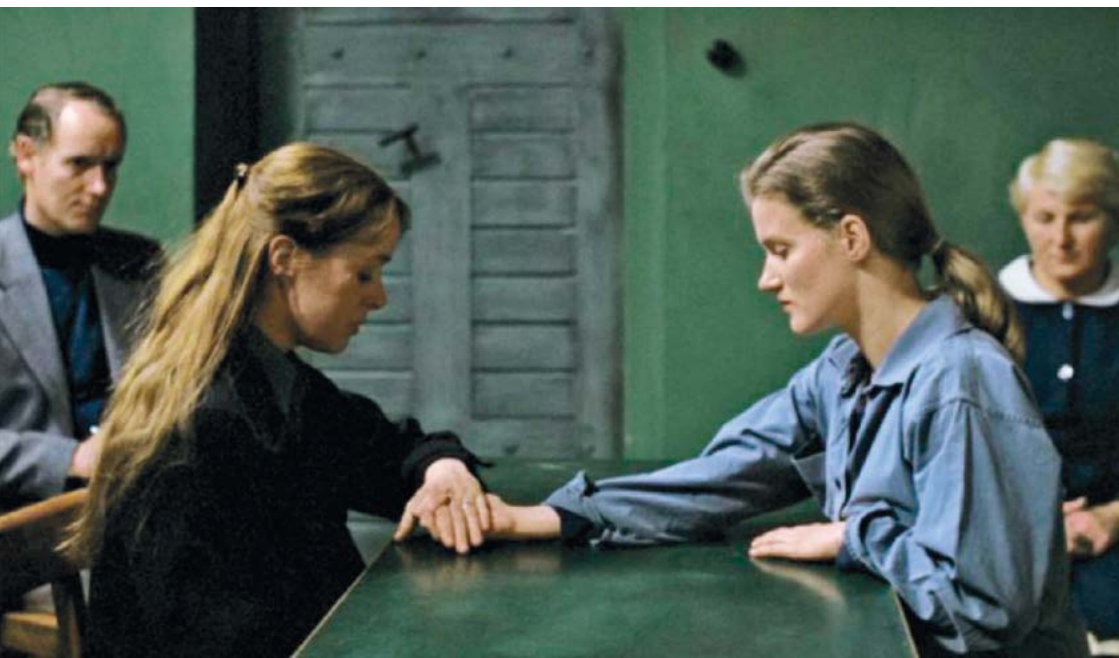
Els anys de plom/ Les germanes alemanyes (Die bleierne zeit, Margarethe von Trotta, 1981)