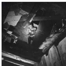
A tiro limpio (Paco Pérez Dolz, 1963)

Amb la col·laboració de l'ESCAC, Escola Superior de Cinema i Audiovisuals de Catalunya