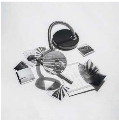
Sense títol n.d. Manoel de Oliveira. Col·lecció Manoel de Oliveira. Casa do Cinema Manoel de Oliveira - Fundação de Serral