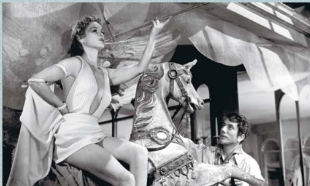
Le plaisir (Max Ophüls, 1952)

Des que es va posar en marxa al novembre de 2018, s'han fet més de 200 sessions de FilmoXarxa arreu de Catalunya, que han aplegat més de 7.000 espectadors.