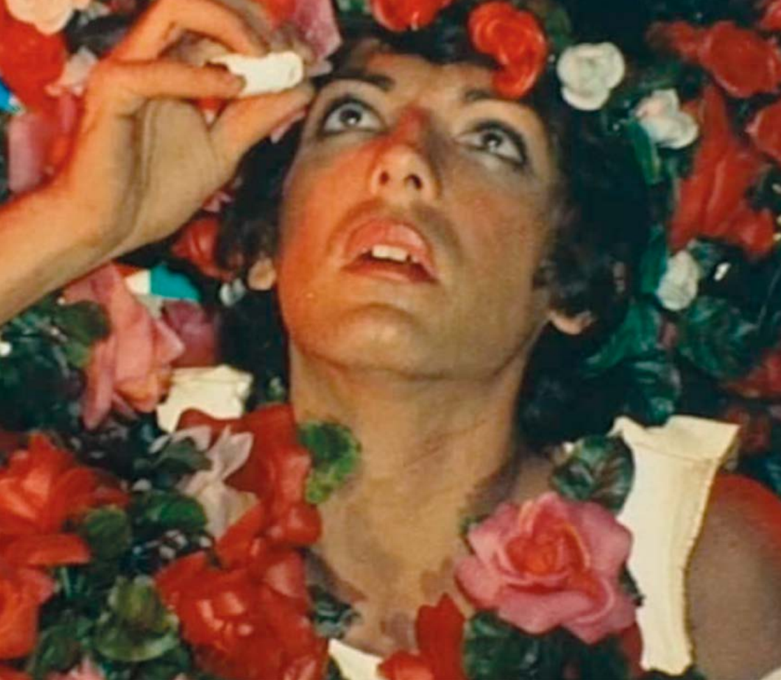
Salomè (Carmelo Bene, 1972)