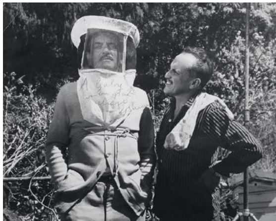
Luis Buñuel i Gabriel Figueroa durant el rodatge de La joven, 1960.

El director aragonès Luis Buñuel i el director de fotografia mexicà Gabriel Figueroa van col·laborar en set pel·lícules entre 1950 i 1964.