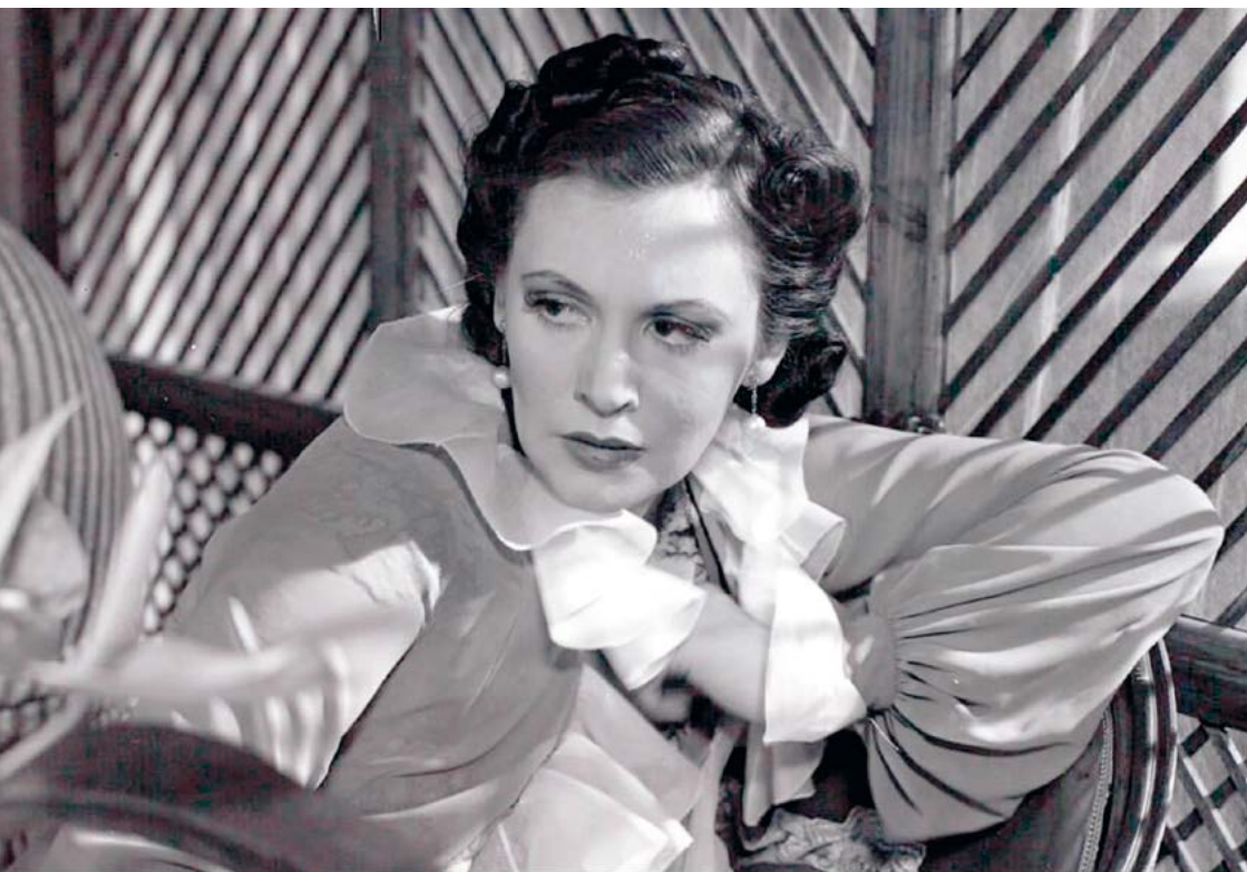
La Habanera (Douglas Sirk, 1937)