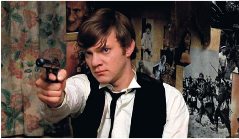
If... (Lindsay Anderson, 1968)