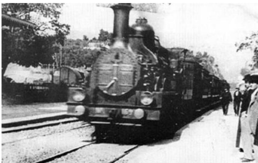
*L'arribada del tren. Germans Lumière. 1895.

Això és un fotograma de la pel·lícula que es va projectar en la primera sessió de cinema de la història. Demaneu als alumnes que el pintin i l'acoleixin.