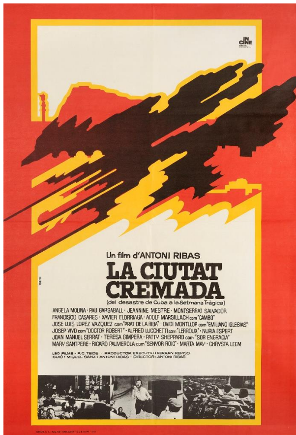
La ciutat cremada (Antoni Ribas, 1975)

Tren de sombras (José Luis Guerin, 1997)