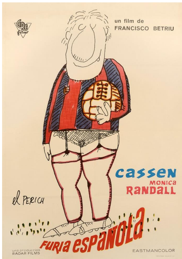
Furia Española (Francesc Betriu, 1974)

La Comissió ha de fer el seguiment de la implantació del Pla de Digitalització de la Filmoteca de Catalunya i transmetre anualment les seves conclusions a l'ICEC.