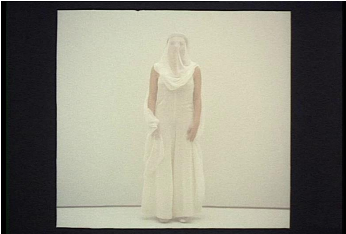
Circles (Ricard Bofill, 1966)