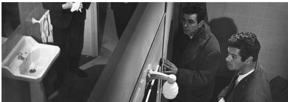
A tiro limpio (Paco Pérez Dolz, 1963)

Aquest projecte té per finalitat preferent donar accessibilitat al cinema produït a Catalunya, mitjançant la digitalització/remasterització de llargmetratges i curtmetratges realitzats a partir de 1940 en suport fotoquímic i dels quals no hi hagi còpies digitals d'alta resolució per a la seva difusió en tot tipus de finestres digitals. La digitalització en alta resolució equipararà els títols de cinema català als d'altres cinematografies, especialment europees, de les quals hi ha una gran demanda per oferir contingut a través de catàlegs especialitzats en cinema de repertori, i en què la qualitat tant artística com tècnica és imprescindible.