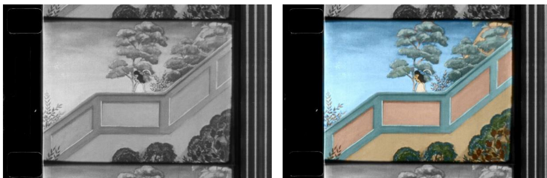
Restauració d' Érase una vez...