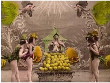
La poule aux oeufs d'or (1905)

Chomón va saber utilitzar la tècnica cinematogràfica per convertir-la en efectes especials, base del cinema de gran espectacle que, amb l'arribada del digital, sovint han esdevingut la seva atracció principal.