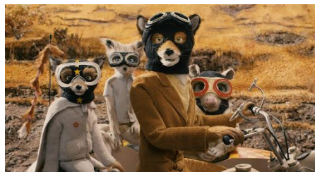
Fantastic Mr. Fox (2009)