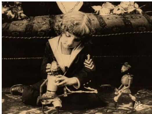
La guerra ed il sogno di Momi