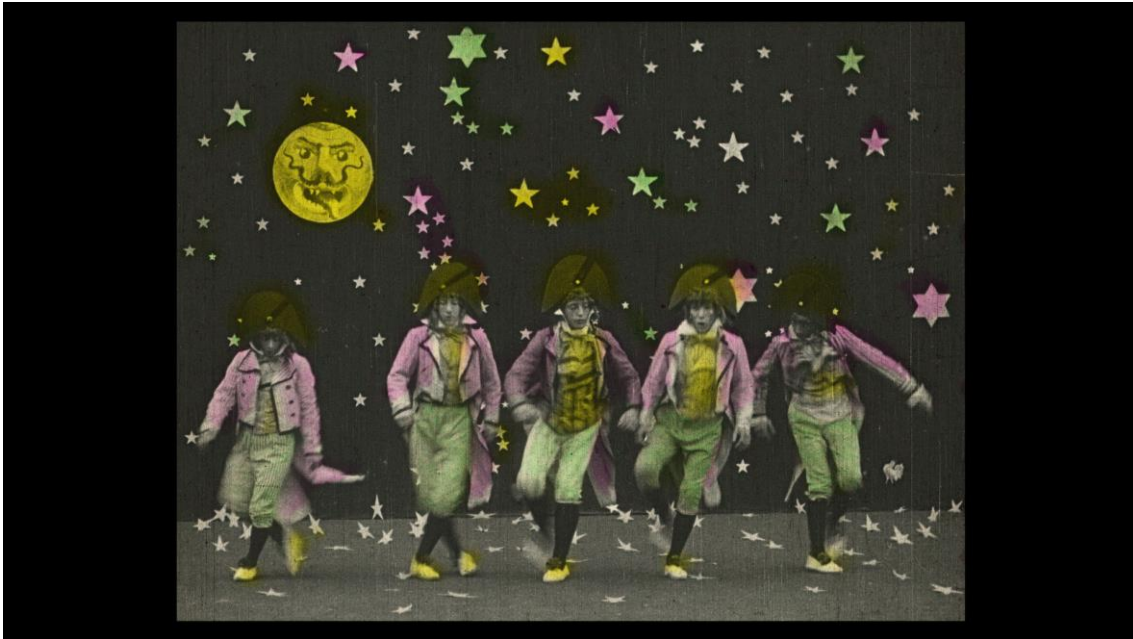
Les lunatiques (1909)

Actiu a Barcelona, París i Torí, Segundo de Chomón Ruiz (Terol, 1871 – París, 1929) fou un dels pioners més destacats dels primers trenta anys del cinema europeu del segle XX. Fill d'un metge militar aficionat a la fotografia. Voluntari a la guerra de Cuba el 1897 i 1899, retorna a Barcelona i és llavors quan s'implicarà en la incipient indústria cinematogràfica de la ciutat, primer instal·lant un taller d'acoloriment de pel·lícules per a empresaris locals i per a cases estrangeres com la Pathé i després com a operador.