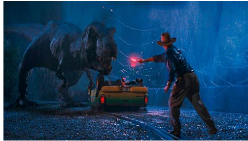
Jurassic Park (1993)