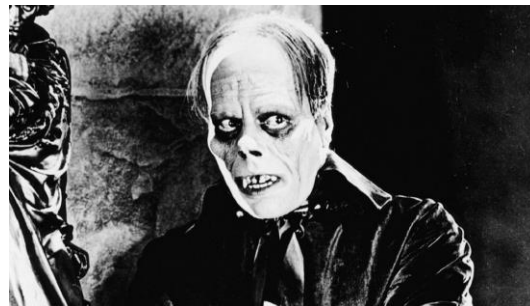
The Phantom of the Opera (1925)