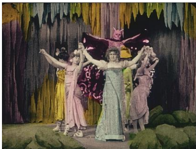
Le spectre rouge (1907)

L'experimentació amb el color va ser una constant en la carrera de Chomón, des del seu taller d'acoloriment manual, passant pel Cinemacoloris, fins al nou sistema en què treballava quan va morir. Les seves peces pioneres dialoguen amb films en què el color també n'és protagonista.