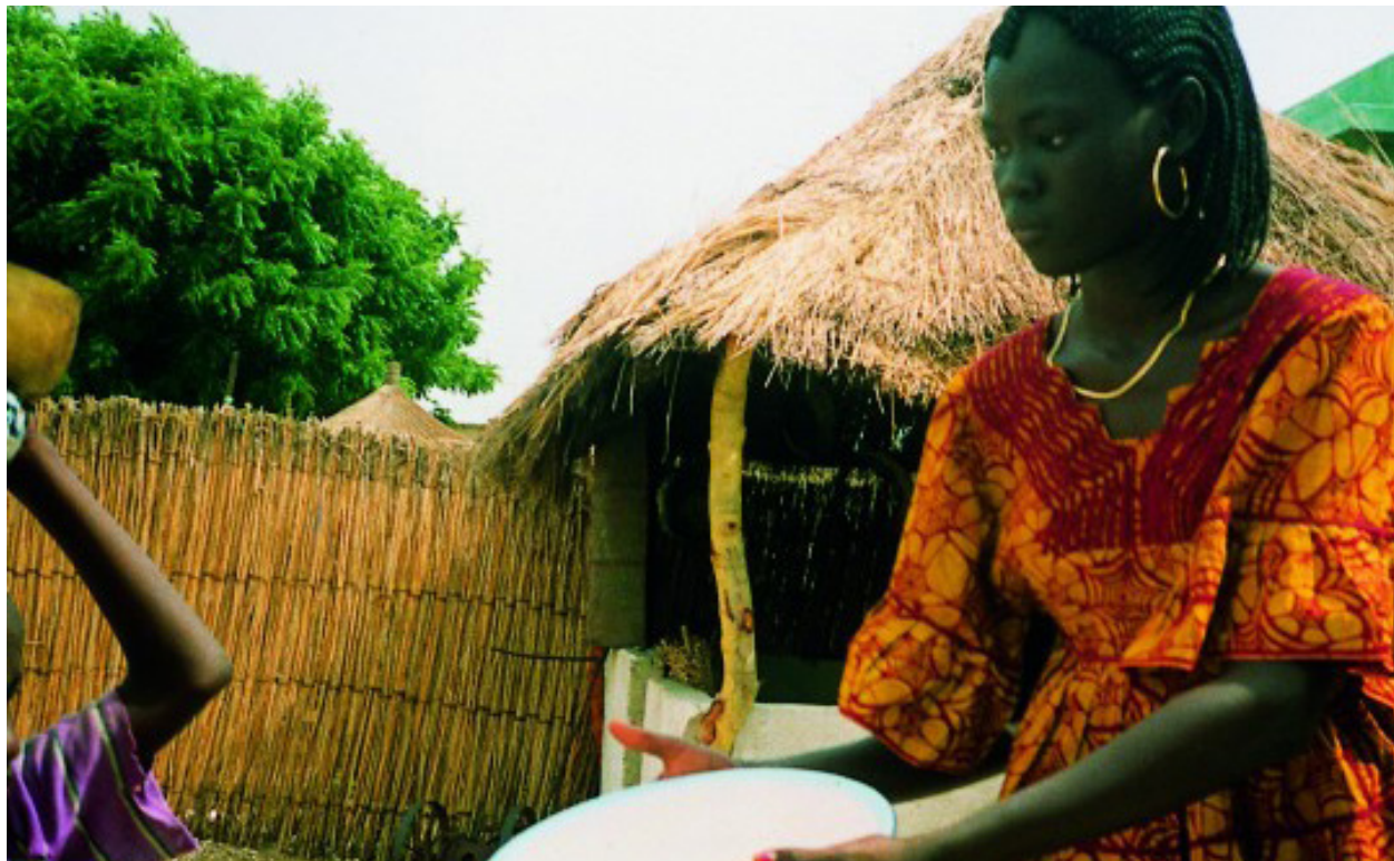
Mossane (1996), de Safi Faye, apunta un cinema compromès amb la realitat del seu continent i amb gran sensibilitat.