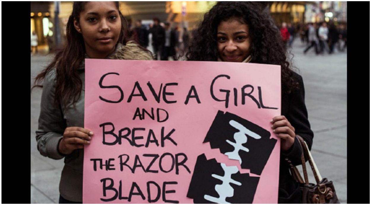
Protesta contra la Mutilació Genital Femenina amb la pancarta "Salva una nena i trenca la fulla d'afaitar".

ministra Cinema-Roma, que posteriorment realitzaria La lotta non é finita (1973), el film mostra la quotidianitat polititzada de dones molt diverses que treballen a casa, que ocupen les fàbriques, que narren experiències sexuals o avortaments clandestins i que denuncien l'educació patriarcal entre primers plans de penis d'estàtues romanes i cites misògines dels "grans" filòsofs.