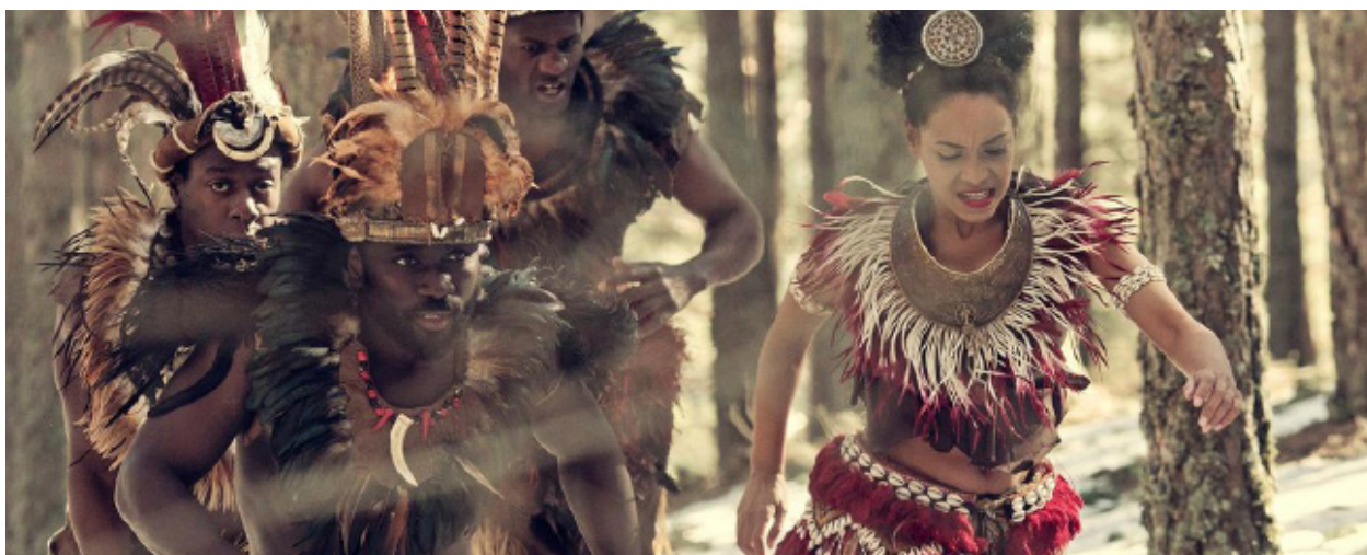
La recurrència a l'estereotip en la representació dels i les negres a Lo nunca visto (Marina Seresesky, 2019) fa que la voluntat de denúncia del racisme es difumini.