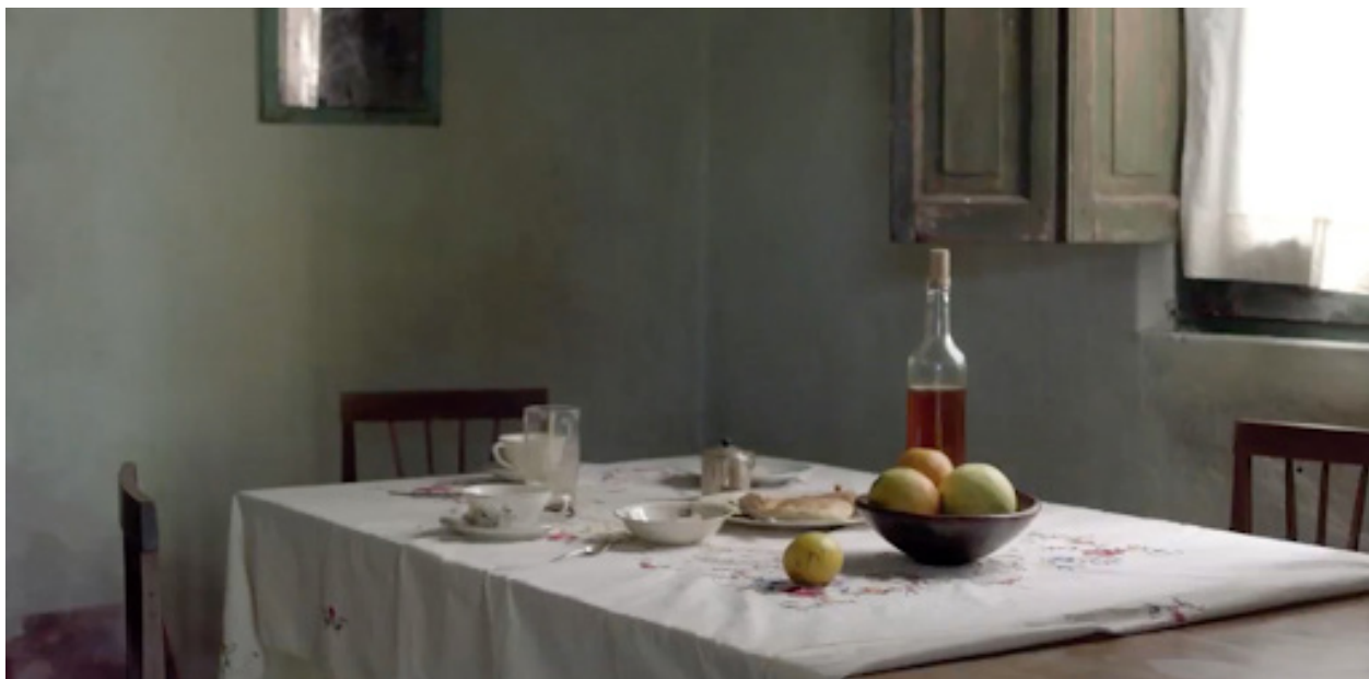
L'arxiu de Goirubú que filma i munta Paz Encina a Ejercicios de memoria (2016) desafia la construcció biogràfica de la víctima.