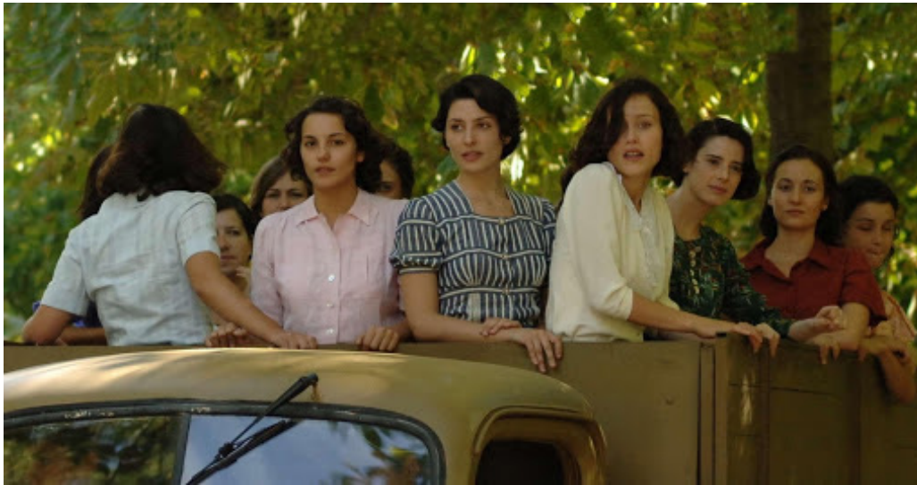
Fotograma de Las trece rosas , d'Emilio Martínez-Lázaro (2007).