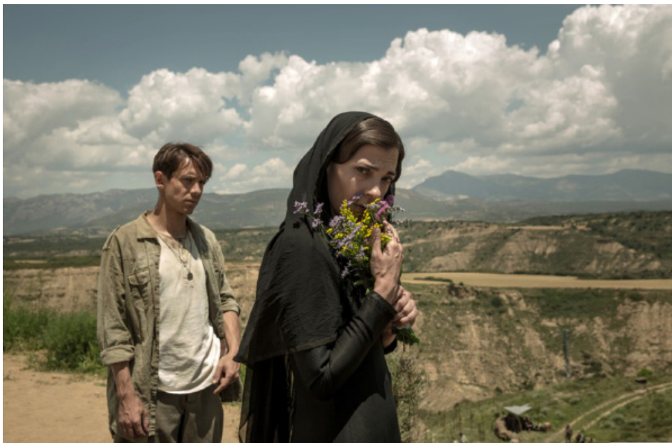
Incerta Gloria (2017) va guanyar el Premi Gaudí a la Millor Protagonista Femenina per Núria Prims.