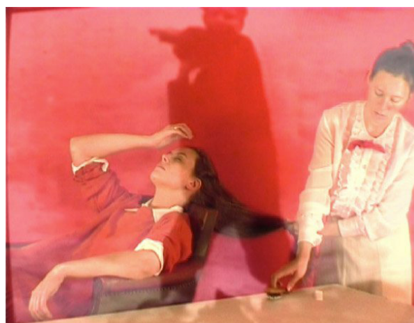
Más muertas vivas que nunca (2002) és una reconstrucció personal de la memòria i el temps en tres moments temporals: l'acció, l'arxiu fotogràfic i el poema recitat.

En el seu darrer llargmetratge, La idea de un lago (2017), la cineasta suïssa-argentina Milagros Mumenthaler, pren un personatge femení en tres moments vitals diferenciats (infància, joventut i a punt de ser mare) marcat per la desaparició del pare en la dictadura argentina. Però ho fa des del retrat poètic i simbòlic de l'absència, suplerta amb altes dosis d'imaginació d'una protagonista que encara està assumint que s'ha quedat òrfena. En una entrevista a Eldiario.es (07/04/2017), li pregunten a la realitzadora: "¿Puede construir el derecho a la memoria un derecho al olvido, como han argumentado algunos filósofos? ¿Es pasar página un acto necesario también? Mumenthaler es tajante. "No creo que haya derecho al olvido. Solo la memoria es sanadora en una sociedad y hace que esta avance. No únicamente con la dictadura, hay muchos otros temas históricos que es necesario abordar. Sin duda, el de los pueblos originarios, que es la deuda pendiente del pueblo argentino. Y muchos otros. Cada país tiene los suyos, ¿no?".